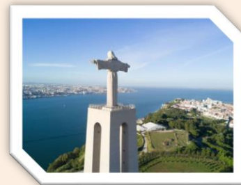
Socha Krista v Almadě