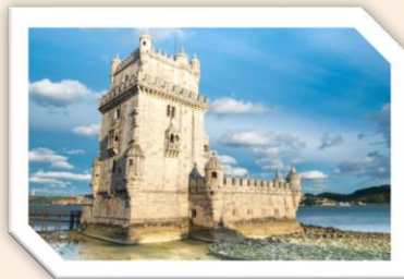
Torre de Belém