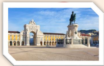
Praça do Comércio