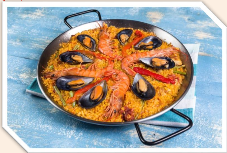
Paella, rýže s plody moře