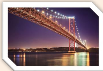
Ponte 25 de Abril